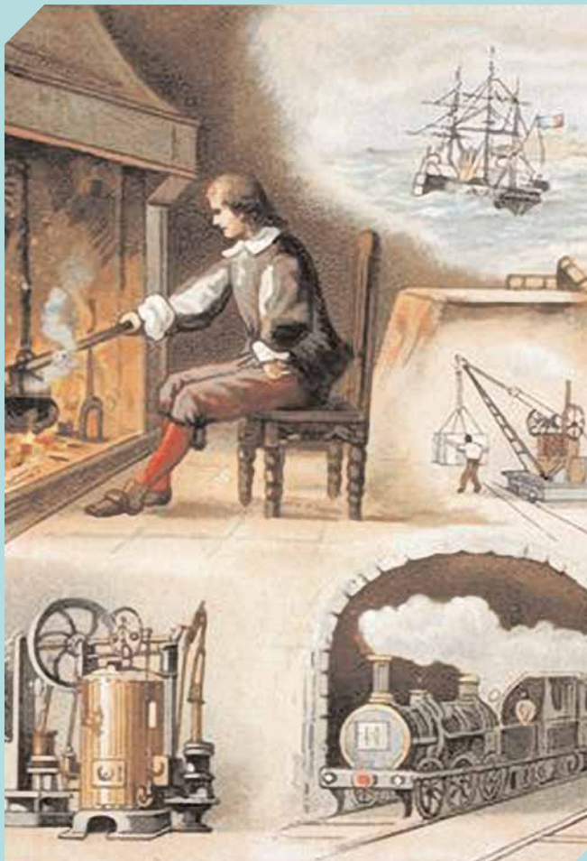
James Watt et les exemples d'utilisation de la vapeur.