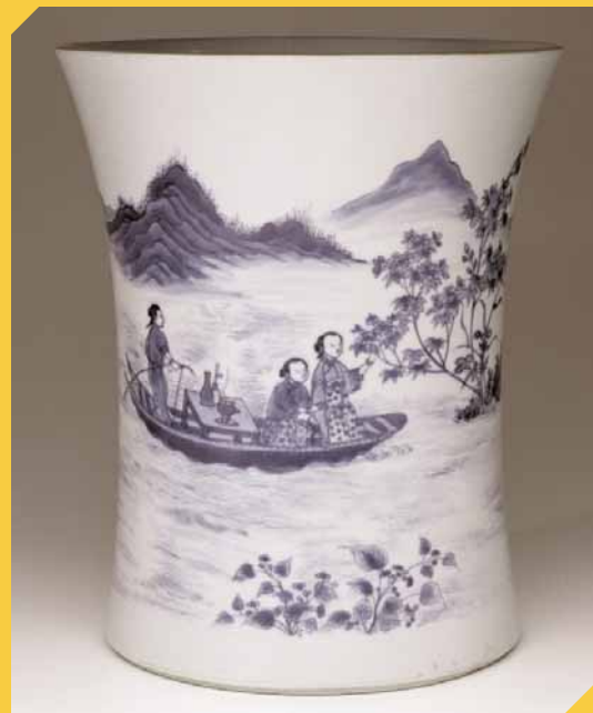
Un vase en porcelaine de Chine, XVII e siècle.

Les Britanniques font du commerce avec la Chine depuis la création de leur Compagnie des Indes, en 1600, et ils établissent dès 1699 un comptoir de commerce à Canton. Ils payent l'essentiel de leurs cargaisons en lingots d'argent, un métal qui est, à l'époque en Chine, plus précieux que l'or. Très vite, les Britanniques importent du thé. Considéré au départ comme une boisson médicinale, le thé devient vite la boisson nationale et fait la fortune de grandes familles de marchands.