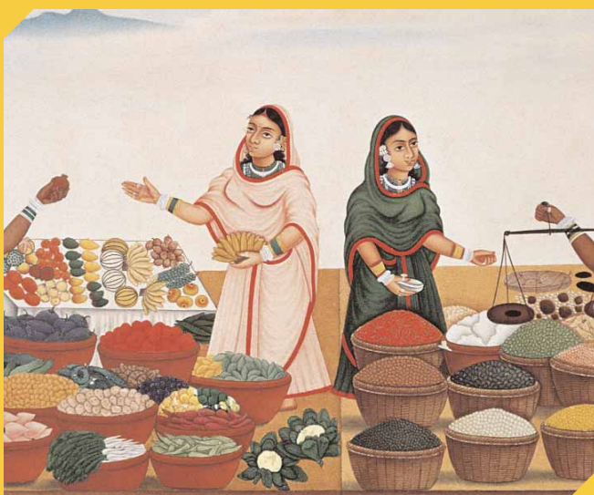
Un marché d'épices et de légumes à Bénarès, en Inde. Peinture du XIX e siècle.

Parfois, les navires, trop chargés ou aux marchandises mal équilibrées, sombrent avant d'avoir atteint leur port d'attache. Le poids de la cargaison est aussi parfois considérablement augmenté par les marchandises que les membres d'équipage cachent sur le bateau. Bien qu'ils n'aient pas le droit de faire du commerce, ils se livrent à la contrebande en achetant des produits qu'ils revendent à leur profit.