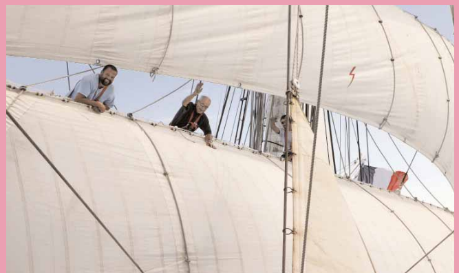
Gros plan sur les voiles du Belem gonflées par le vent.