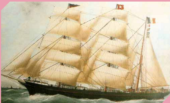
Le Belem, peinture de Charles Adam, 1902.

Le vent qui souffle dans les voiles propulse le bateau et lui permet de naviguer. Le navigateur règle ses voiles pour atteindre ses objectifs de vitesse ou de direction, et pour maintenir l'équilibre de son bateau en fonction des conditions météorologiques. Les voiles d'un bateau ont des formes différentes, et chacune a un rôle précis. Ce ne sont pas de simples morceaux de toile, elles peuvent être renforcées à certains endroits, dotées de pinces à d'autres... Ce sont les maîtres voiliers qui conçoivent les voiles. Avant de se mettre au travail, ils étudient précisément la structure du bateau et les besoins du navigateur.